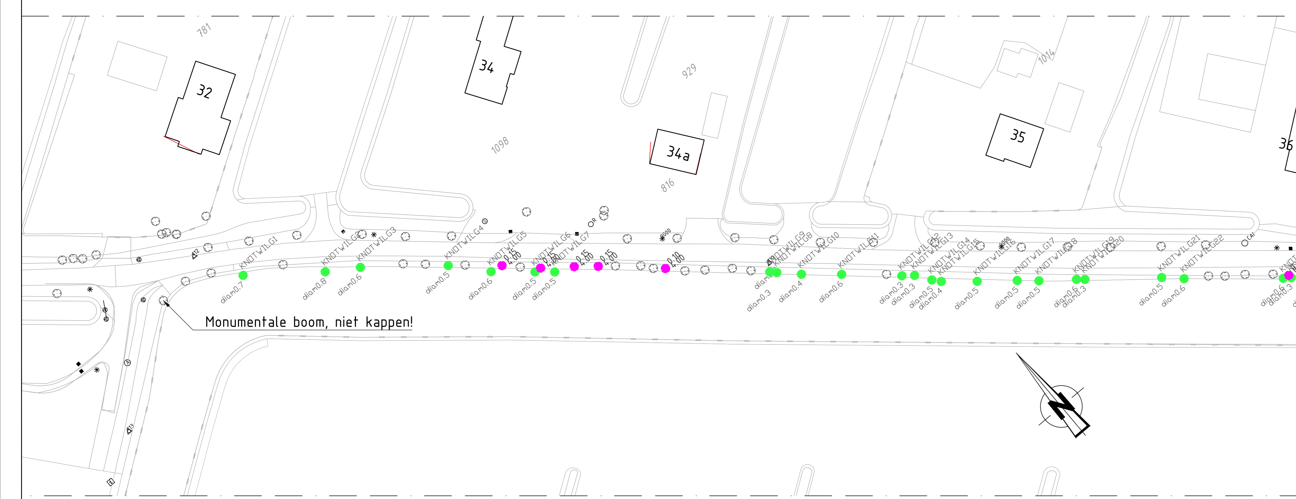
Bovenaanzicht deelkader 3 Schaal 1:500