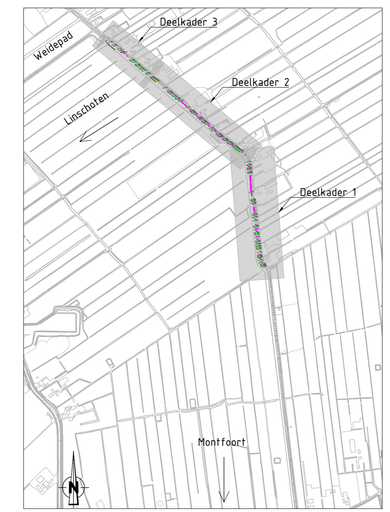
Situatie Schaal 1:10.000