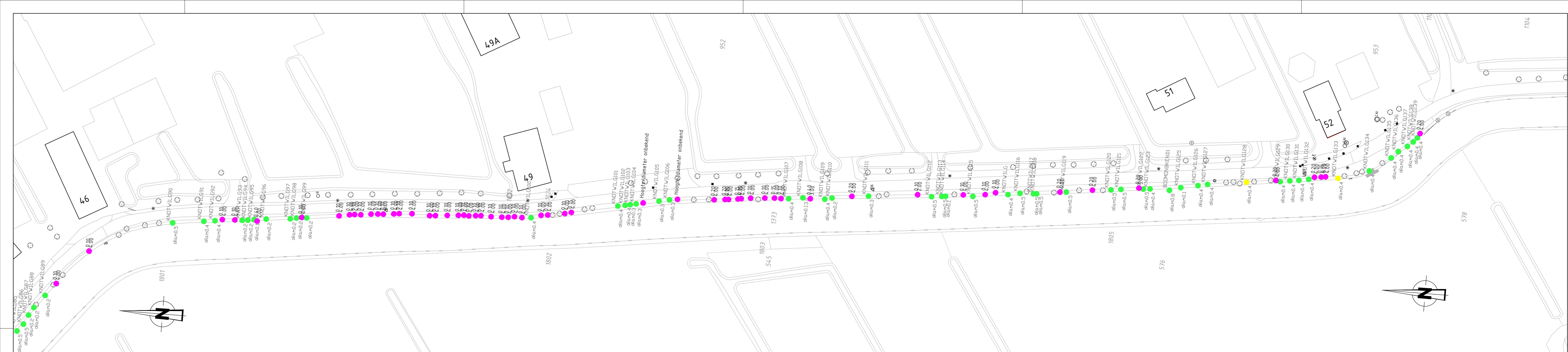
Bovenaanzicht deelkader 1 Schaal 1:500