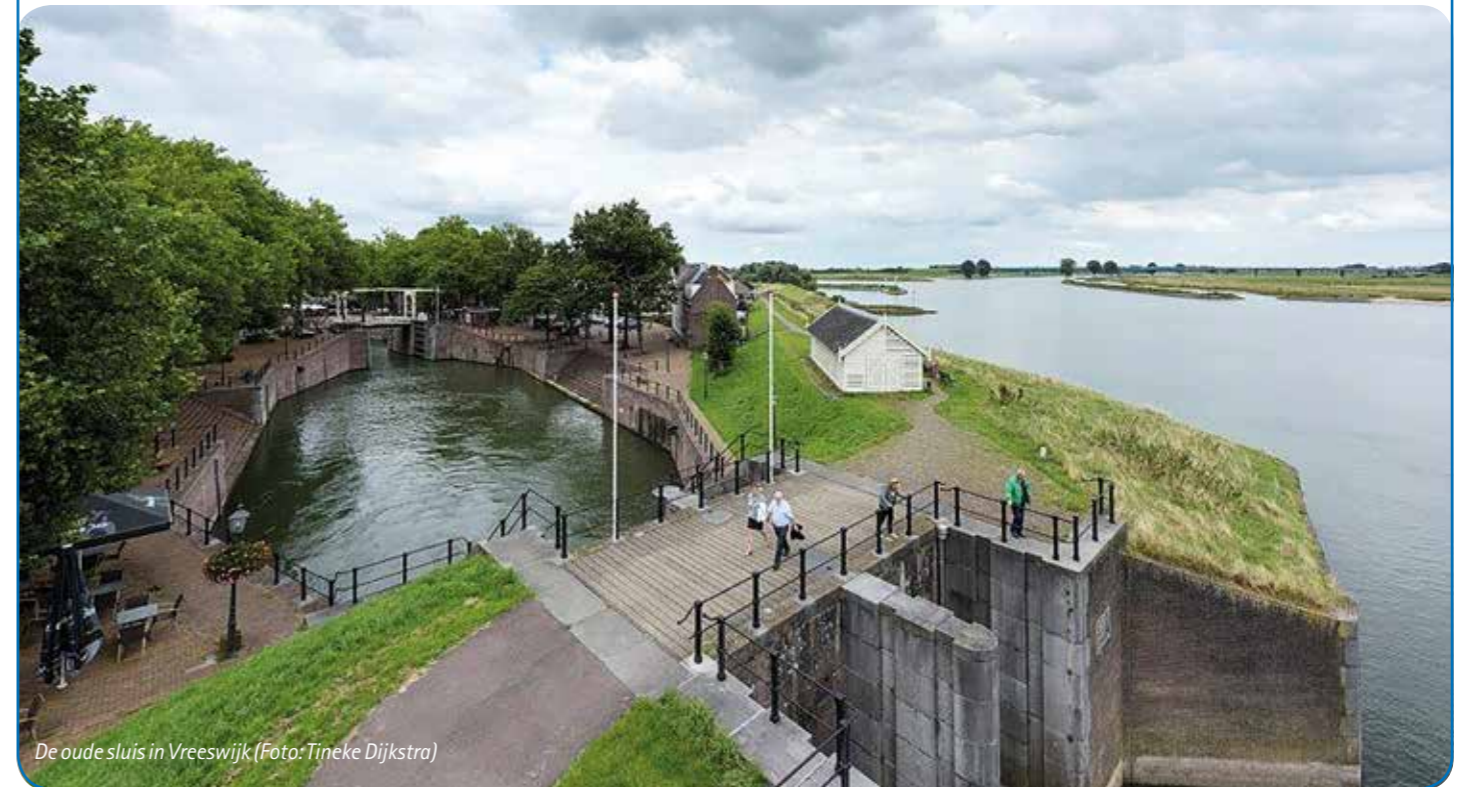
De oude sluis in Vreeswijk

om het water te kunnen inzetten voor de verdediging van het land. Vanwege die bijzondere cultuurhistorie en het kenmerkende natuur en landschap in de uiterwaarden is de Lekdijk tegenwoordig een trekpleister voor fietsers, wandelaars en motorrijders. Ook geliefd bij bewoners zelf. Kortom: een dijk voor iedereen.