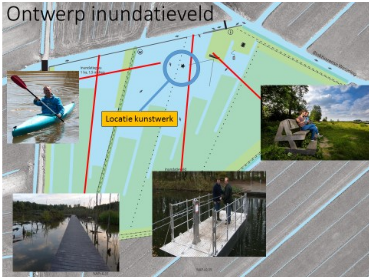
Figuur 2 Locatie kunstwerk en overige elementen inundatieveld

Het kunstwerk is voorzien op een locatie waar het hele jaar door water staat (zie figuur 2). Tijdens inundatie zal ook op deze plek het waterpeil 50 centimeter stijgen.