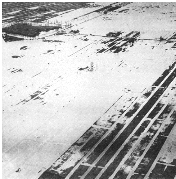
Figuur 1 Locatie inundatieveld en oude foto van geïnundeerd veld