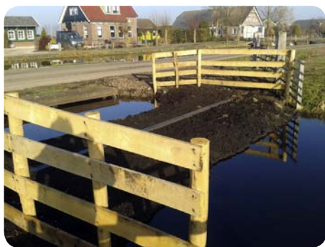
Peilscheidingsconstructie: een gronddam.

HOOGHEEMRAADSCHAP DE STICHTSE RIJNLANDEN