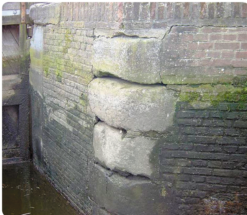
Het metselwerk van de Goejanverwellesluis is in slechte staat

Behalve de bereikbaarheid zullen de werkzaamheden ook andere consequenties met zich meebrengen. Dat zal met name in de vorm van geluid en trillingen zijn, veroorzaakt door onder andere vrachtverkeer, graafmachines en sloopwerkzaamheden. Vóór de start van de werkzaamheden wordt de huidige staat van de omliggende panden vastgelegd op beeld. Indien er voor een bepaalde tijd veel overlast verwacht wordt, zal het waterschap u daarvan tijdig op de hoogte brengen.