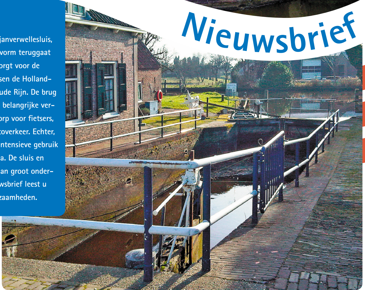
Zicht op de Goejanverwellesluis in Hekendorp

De historische Goejanverwellesluis, die in zijn huidige vorm teruggaat tot de 16e eeuw, zorgt voor de vaarverbinding tussen de Hollandse IJssel en de Oude Rijn. De brug over de sluis is een belangrijke verbinding in Hekendorp voor fietsers, voetgangers en autoverkeer. Echter, de historie en het intensieve gebruik laten hun sporen na. De sluis en sluisbrug zijn toe aan groot onderhoud. In deze nieuwsbrief leest u meer over de werkzaamheden.