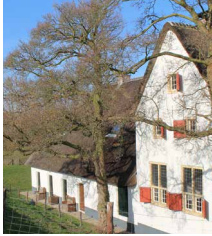
Foto opnamen van de binnen- en buitenkant van de panden (nul-opnames)

Kort voor de start van de werkzaamheden maken we foto's van de panden. Dat doen we binnen en buiten. Dat geldt ook voor de funderingen en kelders. Met de foto's leggen we voor het oog vast wat op dat moment de staat is van de panden.