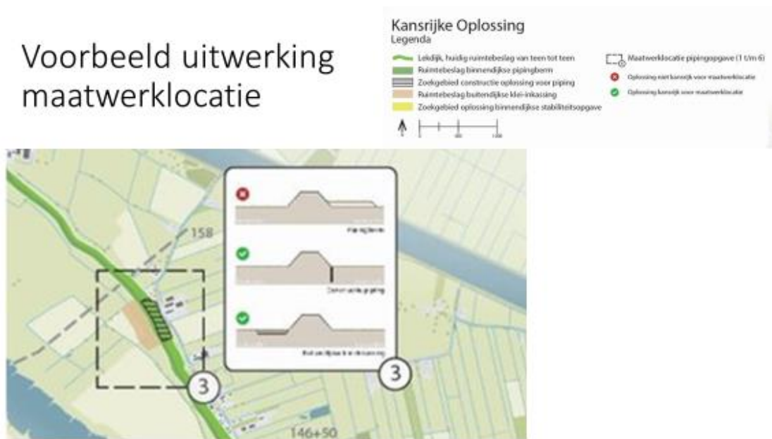
Figuur 2: voorbeeld uitwerking kansrijke oplossing