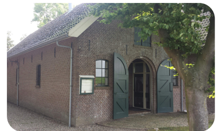
Afbeelding 3: dijkmagazijn en Dijkhuis de Heul

Materialen voor het dijkleger, zoals schoppen, kruiwagens en lantaarns werden in dijkmagazijnen bewaard. Deze worden nu niet meer als opslag gebruikt. Dijkmagazijn de Heul in Schalkwijk is nu een museum over de geschiedenis van Schalkwijk en Tull en 't Waal. Voor meer informatie, zie de website Museum Dijkmagazijn de Heul .