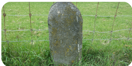
Afbeelding 1: verhoefslagpaal

Bewoners aan de dijk kregen een dijkvak toegewezen dat zij moesten onderhouden. Dit werd aangegeven door zogenaamde 'verhoefslagpalen'. Tussen Nieuwegein en Schoonhoven staan nog ruim 150 verhoefslagpalen op de Lekdijk. In de binnenstad van Wijk bij Duurstede zijn er echter meer dan honderd hergebruikt als anti-parkeerpaaltje. Deze palen staan allemaal op onze digitale watererfgoedkaart .