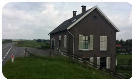
Afbeelding 2: wachthuis

Zij verzamelden zich in één van de wacht- of waakhuisen langs de Lekdijk. Deze zijn nog steeds te herkennen aan een genummerde stenen paal boven aan de dijk.