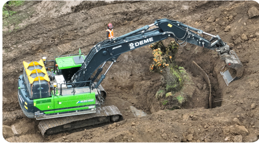
Afbeelding 1: verplaatsing van een knotwilg

In dijkvak Buitenpolder werken we aan de buitenkant van de dijk. We maken de dijk hier sterker met klei. Deze werkzaamheden zijn begonnen op 9 februari. Langs dit deel van de dijk staan bijzondere knotwilgen. Om de beheerstrook vrij te maken, hebben we deze bomen eerst geknot (gesnoeid) en vervolgens verplaatst naar een andere plek verder van de dijk. Zo blijven de bomen behouden en ontstaat er voldoende ruimte om veilig te kunnen werken. Sommige bomen kunnen niet verplaatst worden. Daarom planten we op die plekken nieuwe wilgenstaken. Zo kunnen we aan de dijk werken en blijven er toch knotwilgen in het gebied.