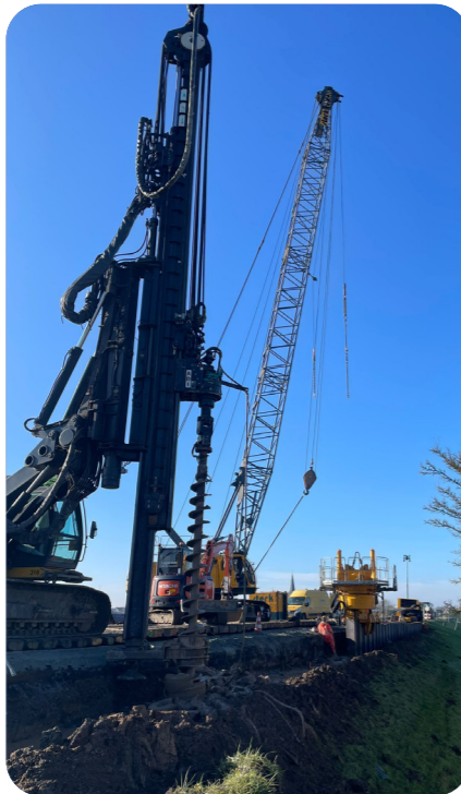
Afbeelding 2: Aanbrengen van damwanden bij Rijndijk 1b/c/d

Vanaf maart vervangen we de damwand aan de westzijde van het inundatiekanaal. De voorbereidingen zijn al begonnen. We hebben proefsleuven gegraven