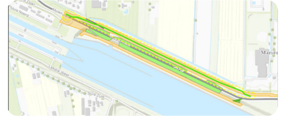
Kaart 2. Locatie van de werkzaamheden tussen de Prinses Irenesluizen en Sportpark Mariënhoeve

Aankomende woensdag 18 februari organiseren we een inloopavond over de werkzaamheden bij Kanaaldijk. U bent van harte welkom tussen 18.30 en 20.00 uur in de hoofdkeet aan Lekdijk Oost 11a in Wijk bij Duurstede. Medewerkers van het waterschap en Lekensembles zijn aanwezig om toelichting te geven en vragen te beantwoorden.