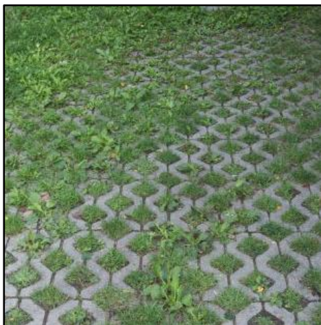
Figuur 2: Met gras door- en overgroeide halfverharding

verhoudt tot het aspect 'aansluiting van de dijk op het landschap' uit het Ruimtelijk Kwaliteitskader Noordelijke Rijn- en Lekdijk Amerongen – Schoonhoven 7 Fout! Verwijzingsbron niet gevonden. . Het effect van beheerstroken op binnendijkse landgebruik en cultuurlandschap is hiervoor toegelicht en wordt beoordeeld als neutraal. Buitendijks is in de huidige situatie al een beheerstrook aanwezig en is geen sprake van een verslechtering. Het aanleggen van aansluitingen van en naar beheerstroken is bedoeld om obstakels, zoals dijkafritten (voorzien van bomenrijen) en bestaande bebouwing (zoals het Oude Veerhuis) te kunnen passeren. Deze aansluiting worden aangelegd met een taludhelling van 1:5 of flauwer en voorzien van een halfverharding. In de eerste periode naar aanleg veranderen deze aansluitingen het aanzicht van karakteristieke dijkafritten en het groene karakter van de dijk. Na verloop van tijd worden de aansluitingen met gras door- en overgroeid en wordt deze aantasting teniet gedaan (zie figuur 2). Het effect van beheerstroken en aansluitingen wordt daarom beoordeeld als licht negatief en tijdelijk van aard. Het aanleggen van beheerstroken heeft geen effect op de overige criteria binnen het thema omgeving (recreatie, verkeer, hinder tijdens aanleg) en wordt daarom als neutraal beoordeeld.