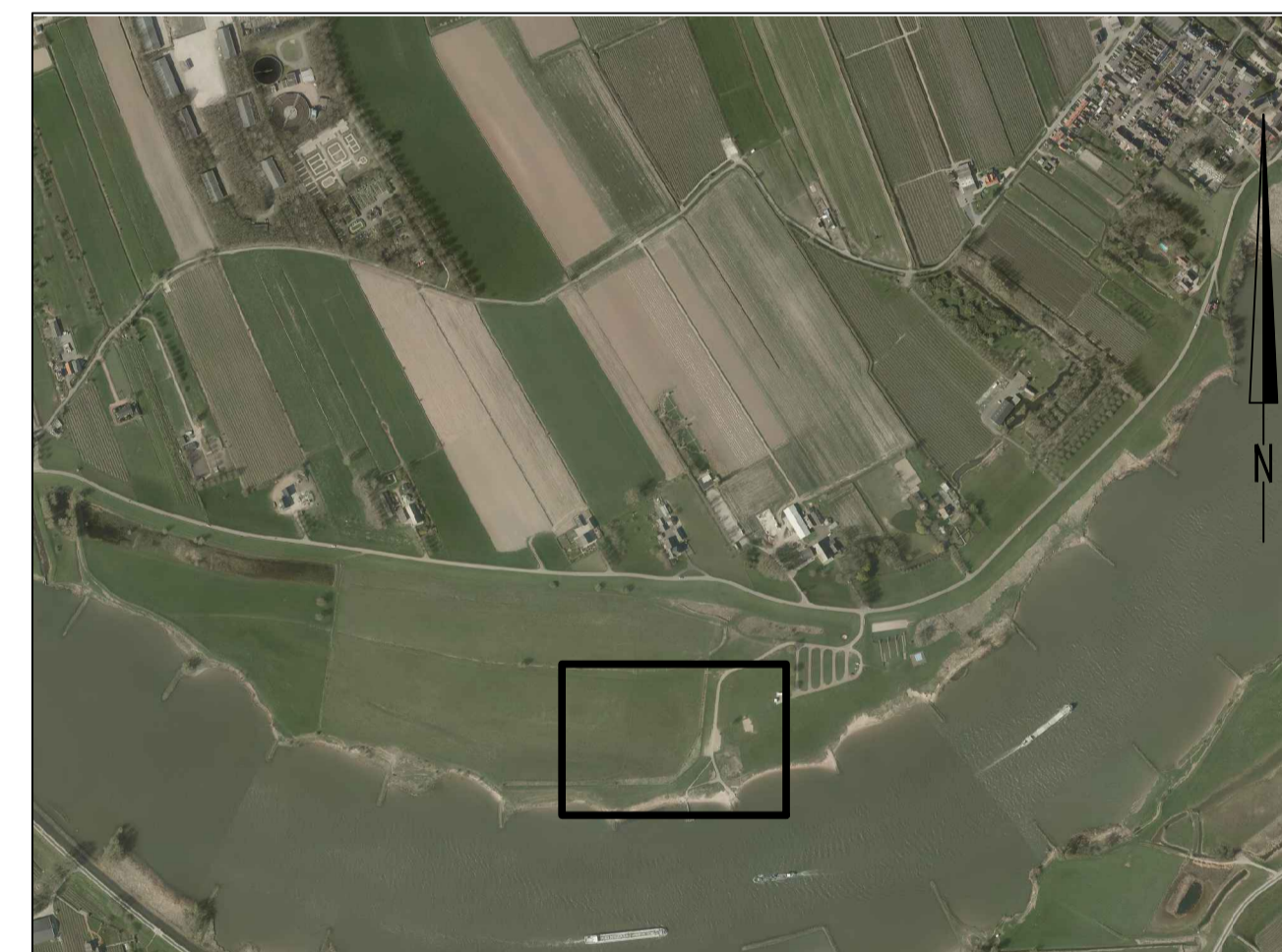
SITUATIE Schaal 1:10.000

Maten in meters, tenzij anders vermeld Diameters in millimeters, tenzij anders vermeld Hoogtematen in meters t.o.v. N.A.P., tenzij anders vermeld