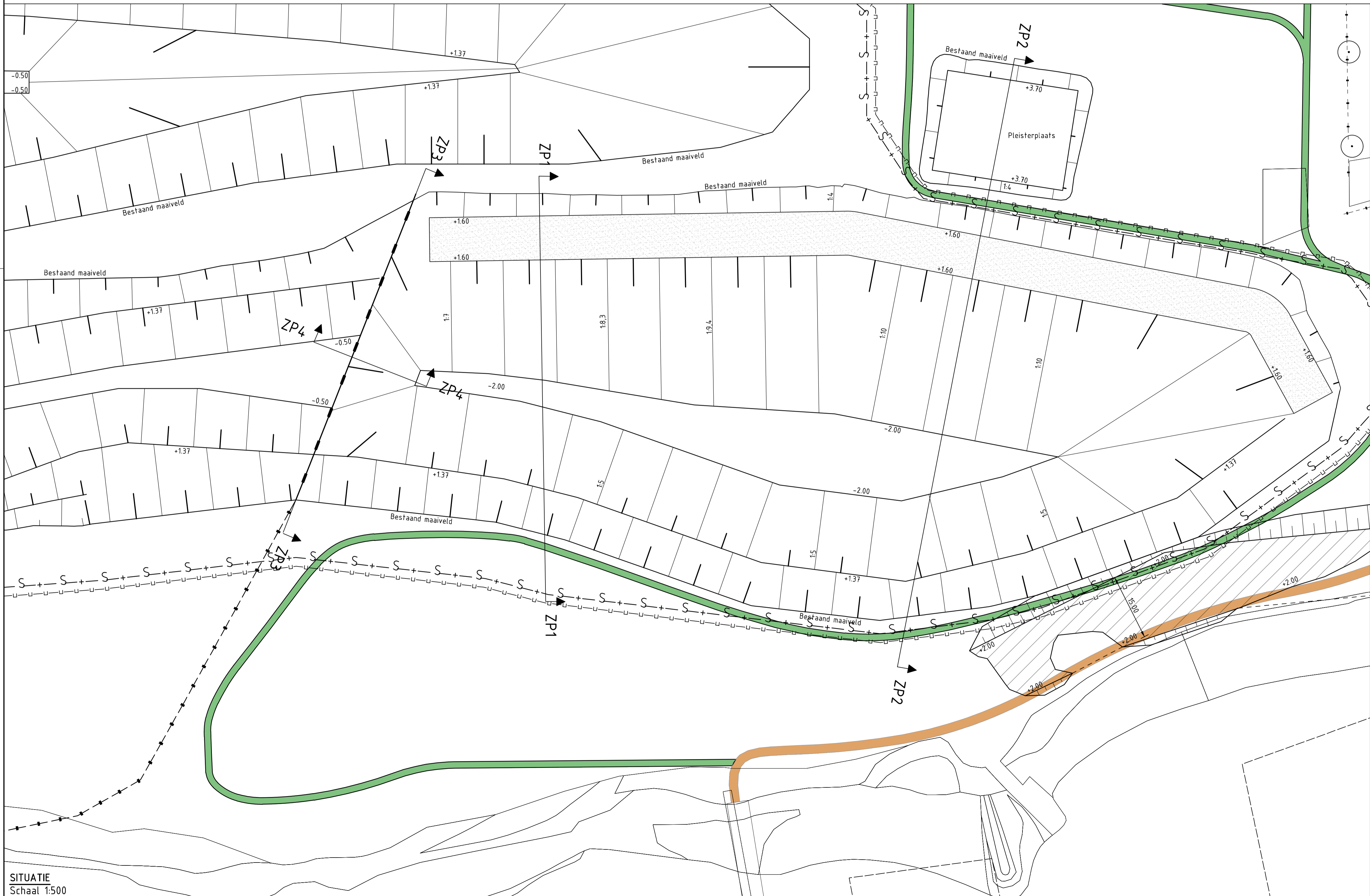
SITUATIE Schaal 1:500