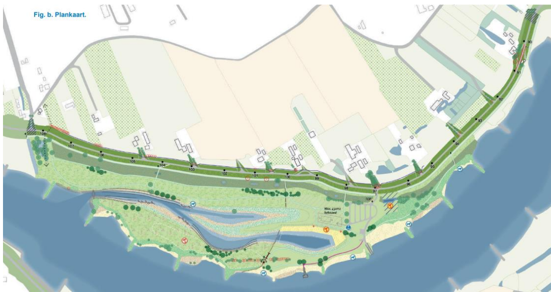
Figuur 1: Plankaart Salmsteke Ontkiemt! (bron: MER, figuur 6-6; legenda zie aldaar).

De Commissie adviseert deze informatie in een aanvulling op het MER op te nemen, en dan pas een besluit te nemen over het projectplan. In hoofdstuk 2 licht de Commissie haar oordeel toe en geeft ze aandachtspunten voor het vervolgtraject.