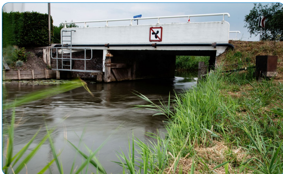
Brug over de Enkele Wiericke.

In het afgelopen jaar zijn oriënterende gesprekken gevoerd met de beheerder van het Fort, direct aanwonenden en mede-overheden over mogelijke oplossingsrichtingen, wensen en eisen. Ook zijn voorbereidende onderzoeken uitgevoerd, zoals naar de aanwezige flora en fauna en de kwaliteit van de (water)bodem.