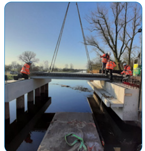
Inhijzen brugdelen nieuwe autobrug, met rechts in het beton de passage voor de otter

nieuwe bruggen. Deze bruggen zijn nu eigendom van gemeente Bodegraven-Reeuwijk. Daarnaast is de watergang verbreed, het compartimenteringswerk vervangen en hebben we een faunapassage voor otters aangelegd. Deze waterliefhebbers vinden het vaak spannend om onder bruggen door te zwemmen. Faunapassages helpen deze dieren dan om zich veilig langs de oevers te verplaatsen zonder dat ze hierbij omkomen in het verkeer.