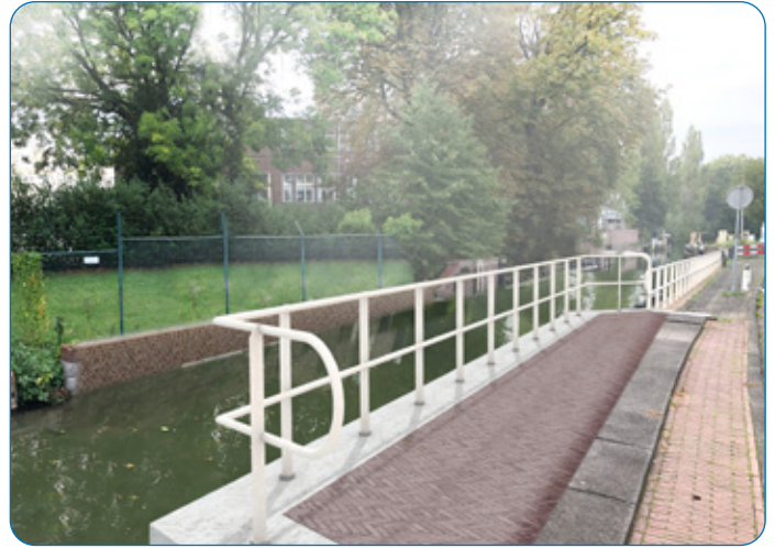
Artist impression nieuwe situatie brughoofd