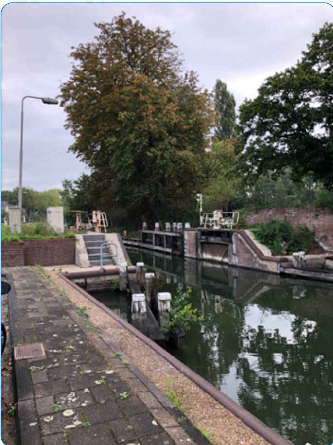
Huidige situatie hoge sluishoofd

De cultuurhistorische elementen, zoals de sluisbediening en het leuningwerk komen terug. Naast de sluis komt een informatiebord om een toelichting te geven over de historie van de plek.