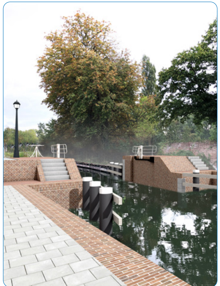
Artist impression nieuwe situatie hoge sluishoofd