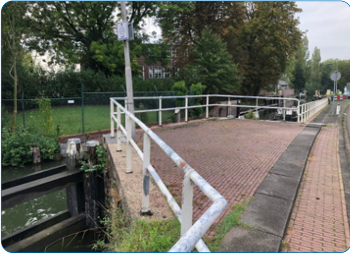
Oude situatie brughoofd

De werkzaamheden staan beschreven in een ontwerp projectplan. Het waterschap legt dit projectplan van 27 augustus tot 8 oktober a.s. ter inzage. In deze periode kunt u reageren op het plan door een zienswijze in te dienen. Het projectplan en de wijze waarop u een zienswijze kunt indienen vindt u vanaf 27 augustus op de website van het waterschap, www.hdsr.nl/kwa .