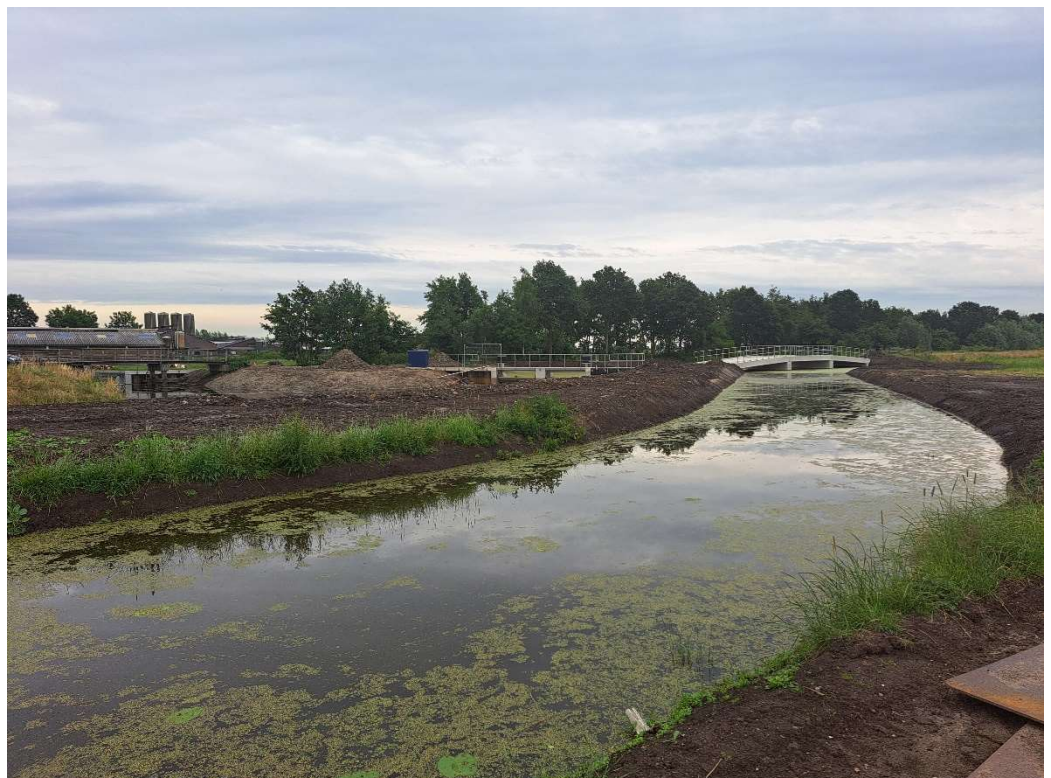
De reeds gerealiseerde werkzaamheden in de polder

In de polder ten zuiden van de Slangeweg zijn reeds diverse werkzaamheden uitgevoerd en afgerond. Zo zijn er drie nieuwe stuwen en twee nieuwe landbouwbruggen gerealiseerd. Ook het verruimen van de watergangen rondom deze objecten is afgerond.