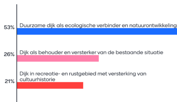
Figuur 2.1. Bewonersavond 27 augustus

Deze kansrijke oplossing spreekt mij het meeste aan: