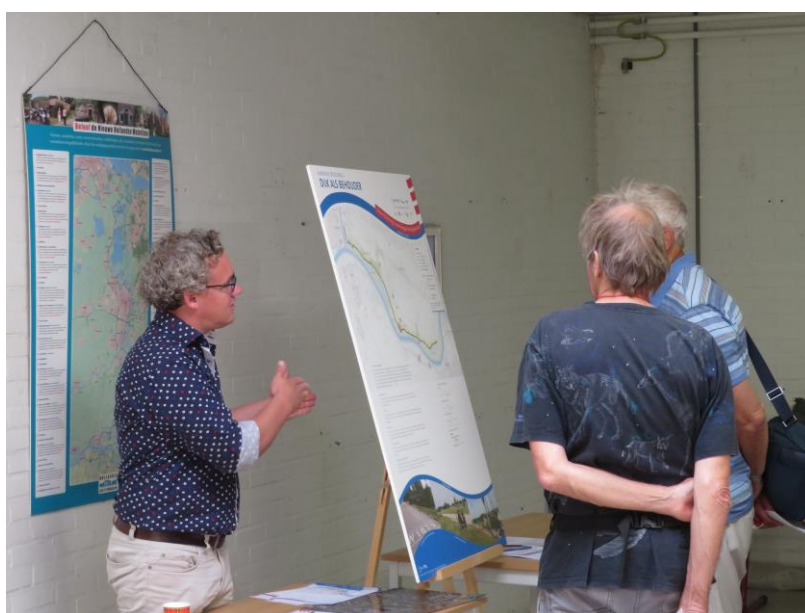
Figuur 1.2. Fysieke avond op Fort Honswijk

De fysieke avond is covid proof georganiseerd, met inachtneming van de RIVM richtlijnen die op dat moment van toepassing waren. Bij de fysieke avond konden mensen zich inschrijven voor een tijdslot van een uur voor een bezoek aan Fort Honswijk. Bezoekers volgden ter plaatse een looproute, langs informatieborden van de drie kansrijke oplossingen en de meekoppelkansenkaart. Zij hadden daar de mogelijkheid om in gesprek te gaan met teamleden die de kaarten toelichtten. Ook is er foldermateriaal meegegeven om alle informatie thuis nog eens rustig na te kunnen lezen. Deze flyers zijn toegevoegd in bijlage 2. Bezoekers konden mondeling hun reactie geven, door middel van het invullen van een formulier, en door post-its achter te laten op de borden van de kansrijke oplossingen.