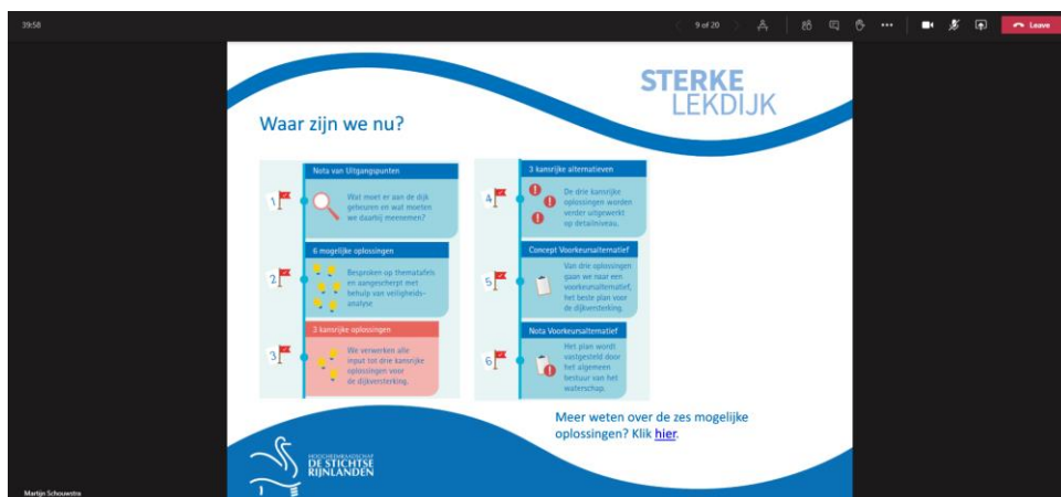
Figuur 1.1. Digitale bewonersavond

een gesprek. In totaal duurde een digitale sessie een uur; mensen konden zich inschrijven voor een tijdslot.