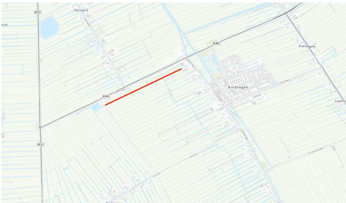
Ligging Achterwetering Kockengen

De Achterwetering is gelegen in de polder Kockengen, aan de westzijde van het dorp Kockengen. De lengterichting van de watergang is van zuidwestelijk naar noordoostelijk. De watergang draagt zorg voor de afvoer van de polder Kockengen en Teckop en wordt bemalen door het nabijgelegen gemaal Kockengen, gelegen bij het voetbalveld ten noorden van de N401.