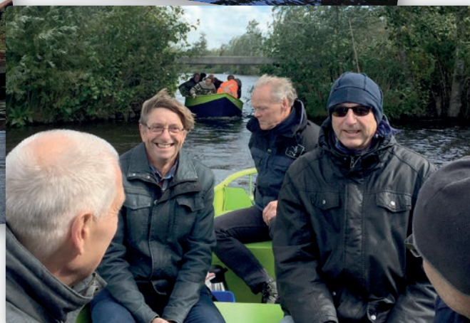
Boottocht van de Klankbordgroep over de Meije