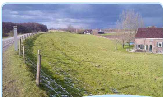
Voormalig wachthuis nr. 2 met wachthuispaal

Het Dijkhuiscomplex is een Rijksmonument en omvat naast het Dijkhuis, met vergaderzalen voor bestuur en dijkgraaf, onder meer een paardenstal uit de 17e eeuw, een dijkmagazijn, een stenen wachthuis en een peilschaalhuis. Samen vertellen ze het verhaal van de eeuwenlange strijd tegen het water, of zoals de spreuk op de gevel aangeeft: Vivo leo cespite tutus - De Hollandse leeuw is veilig achter de groene zoden van de dijk.