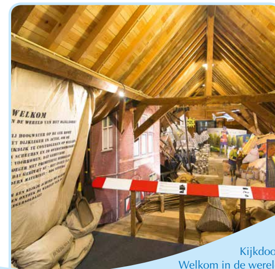
Kijkdoos Welkom in de wereld van het dijkleger

Tijdens een rondleiding start u met een bezoek aan de exposities op de zolders van de Zwarte Schuur en het stenen wachthuis. ‘Welkom in de wereld van het Dijkleger’ is een levensgrote ‘kijkdoos’ met beelden van het dijkleger vroeger en nu; de expositie ‘Dijkhuis en waterbeheer’ geeft inzicht in de geschiedenis van het Dijkhuis en natuur en cultuurhistorie op en rond de Lekdijk. Bij de rondleiding bezoekt u deze exposities, de omgeving van het dijkhuis en de grote vergaderzaal en de dijkgraafkamer in het Dijkhuis. U krijgt een beeld van het leven en werk van dijklegersoldaten en adellijke dijkgraven en hoogheemraden uit vroeger tijden.