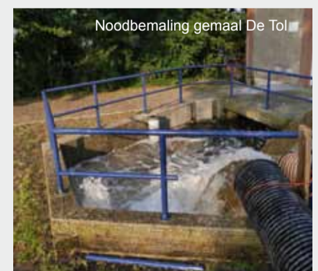
Noodbemaling gemaal De Tol

De gemeente Stichtse Vecht heeft de inspectie van dit gemaal geïntensiveerd. Elke twee weken vindt controle plaats en worden de roosters schoongemaakt.