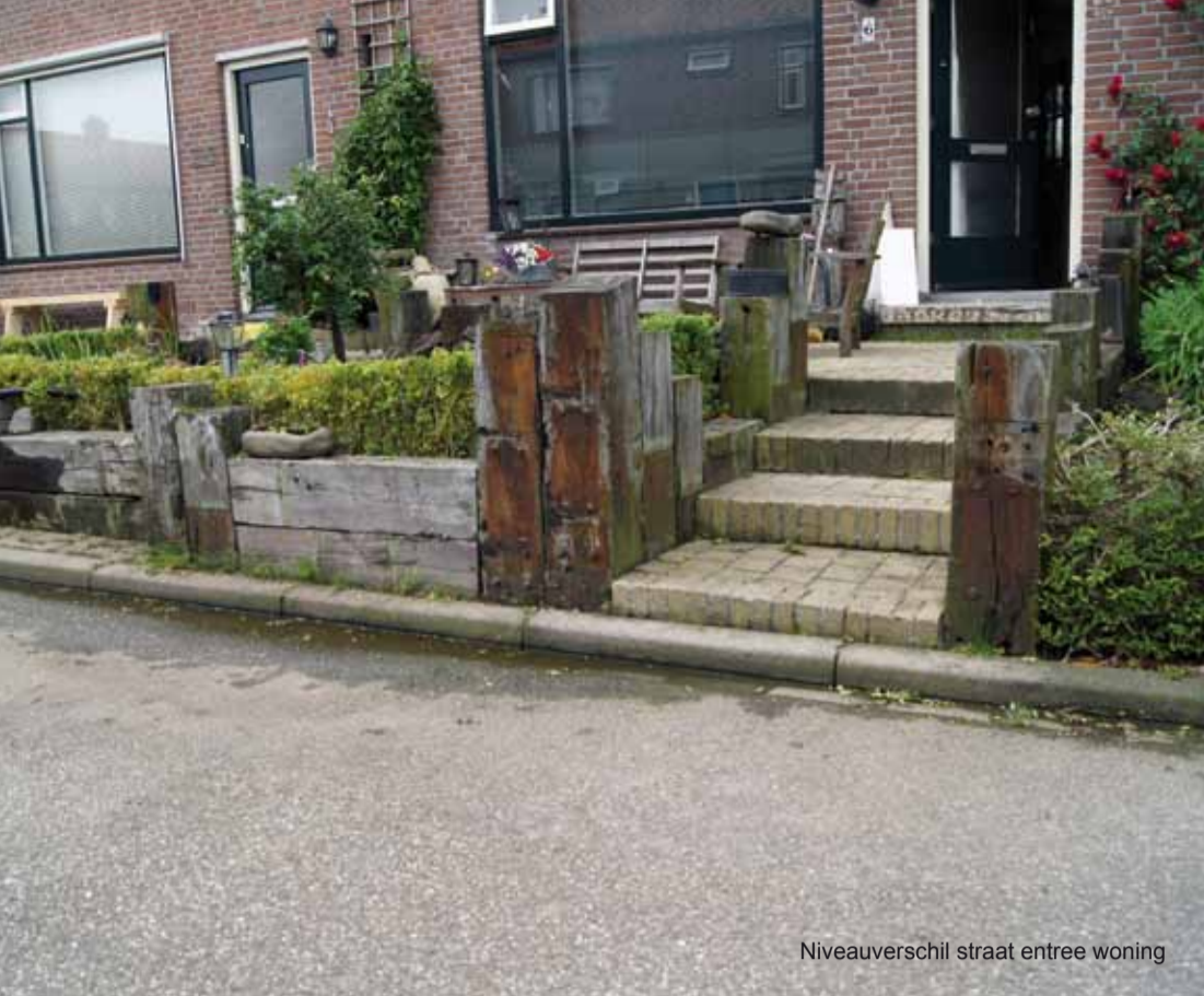
Niveaoverschil straat entree woning