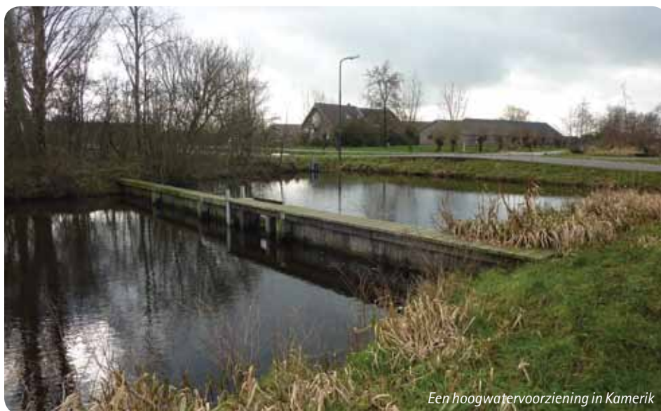
Een hoogwatervoorziening in Kamerik

omliggende poldergebied beperkt blijft. Tot nu toe werd in een hoogwatervoorziening het peil bij het opstellen van een nieuw peilbesluit vaak op hetzelfde niveau gehouden.