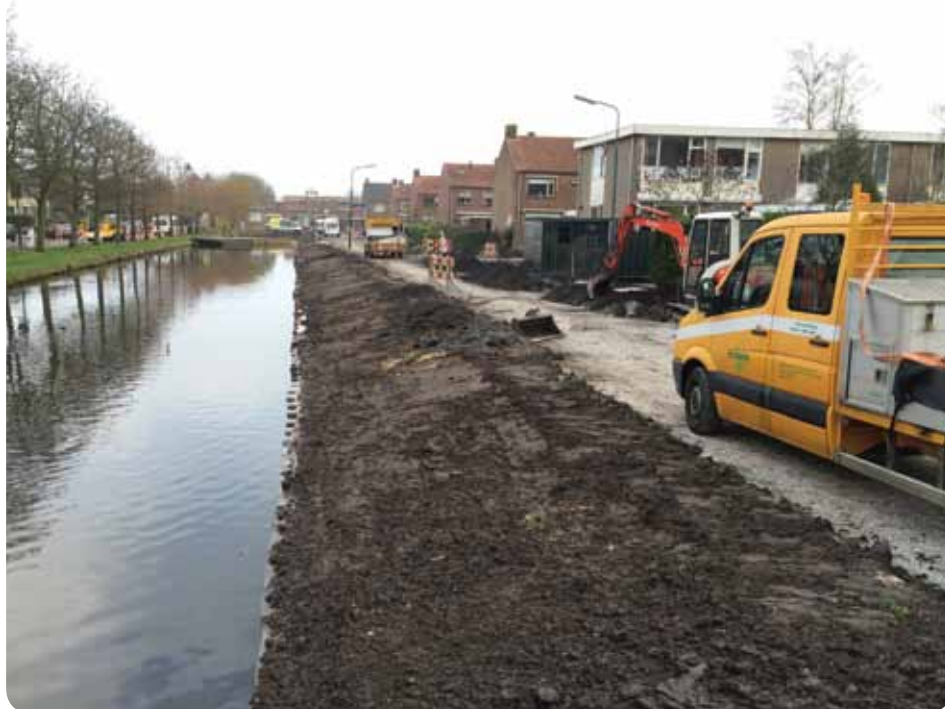
De Van Zuijlenweg in Kockengen is een van de straten die wordt opgehoogd.

gaat om het toekomstperspectief voor het gebied. Daarom is het waterschap nauw bij beide processen betrokken, en is het verantwoordelijk voor het vastleggen van gemaakte afspraken in nieuwe peilbesluiten.