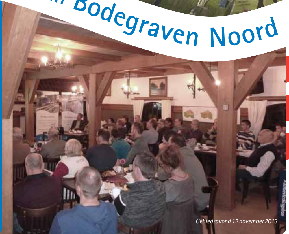
Gebiedsavond 12 november 2013

HOOGHEEMRAADSCHAP DE STICHTSE RIJNLANDEN