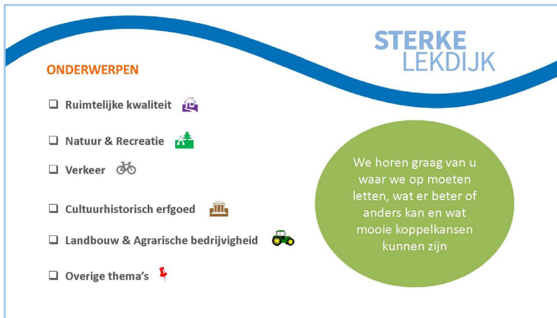
Onderwerpen & thema's die aan bod komen in de werksessies