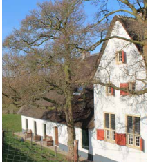
Foto opnamen van de binnen- en buitenkant van de panden (nul-opnames)

Kort voor de start van de werkzaamheden maken we foto's van de panden. Dat doen we binnen en buiten. Dat geldt ook voor de funderingen en kelders. Met de foto's leggen we voor het oog vast wat op dat moment de staat is van de panden.