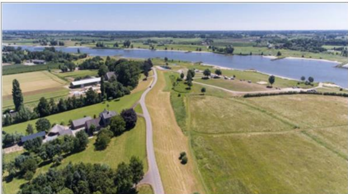
Figuur 1 Impressie van het plangebied in de huidige situatie

De Lekdijk tussen Amerongen en Schoonhoven is in de laatste beoordeling afgekeurd en voldoet grotendeels niet aan de veiligheidseisen. De dijk is veelal niet voldoende sterk meer en op een beperkt aantal plekken onvoldoende hoog. Versterking van ca. 55 kilometer van de Lekdijk is nodig om de veiligheid van het achterland, waaronder ook een deel van de Randstad, in de toekomst te waarborgen. De beheerder van de dijk, Het Hoogheemraadschap De Stichtse Rijnlanden (HDSR), is daarom het project Sterke Lekdijk gestart. Het doel van de Sterke Lekdijk is om een waterkering te realiseren binnen de brede context van de omgeving. Dit betekent dat de dijkversterking landschappelijk is ingepast, koppelkansen zijn afgewogen en raakvlakprojecten in beeld zijn. De dijkversterking is opgenomen in het Hoogwaterbeschermingsprogramma (HWBP, onderdeel van het Deltaprogramma) waarin de waterschappen en Rijkswaterstaat samenwerken om de primaire waterkeringen aan de veiligheidsnorm te laten voldoen. Gezien de omvang (55 km), wordt de versterking van de Lekdijk aan de hand van 6 deelprojecten opgepakt. Eén van deze deelprojecten is de dijkversterking bij Salmsteke.