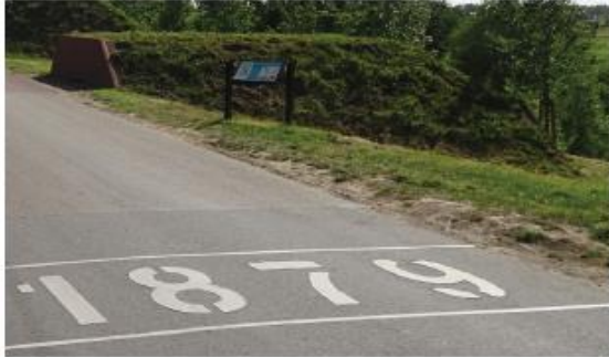
zichtbaarheid Werk aan de Groeneweg