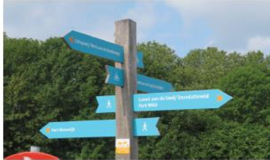
stimuleren recreatie NHW en Liniepontje