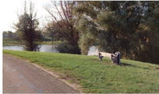
inspiratiebeeld rustpunt op de dijk