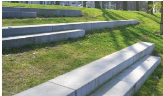
zitranden op het dijktalud, uitzicht uiterwaard