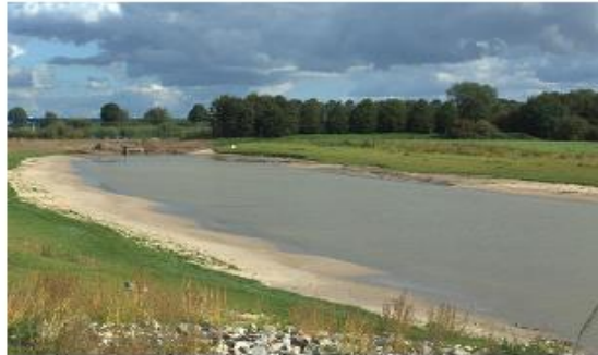
aanleg geul in de uiterwaarden