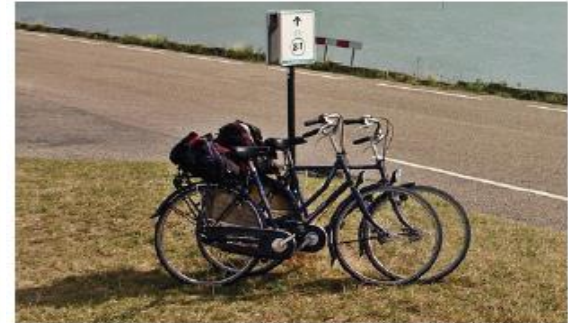
stimuleren recreatie op de dijk en uiterwaarden