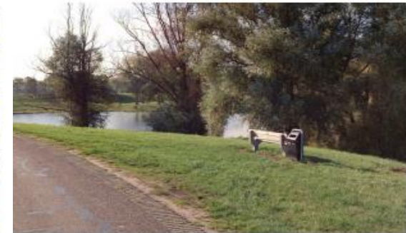
rustpunt langs de dijk