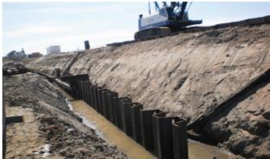
voorbeelden constructie in de dijk