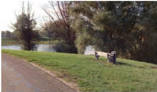
rustpunt langs de dijk