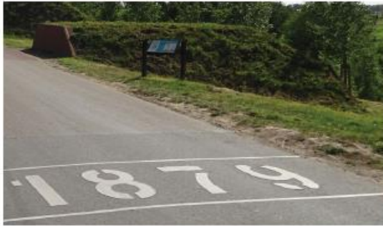
inspiratiebeeld werk aan de Groeneweg