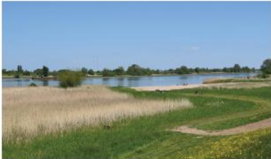
natte natuurzones langs de dijk