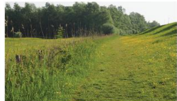
struinp pad langs de dijk