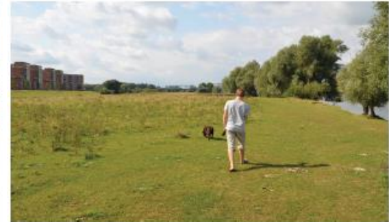
extensieve recreatie in het oosten: struinen